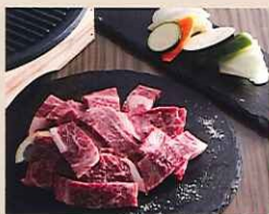
かまくらバーベキューセット

かまくら 6人部屋 / 3棟 営業時間 11:00~20:00 定休日:木曜日(積雪、予約状況により臨時休業あり) 全て前日までの要予約