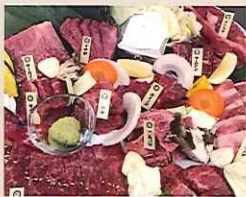
但馬牛 特選12部位セット