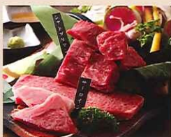
かまくら極バーベキューセット