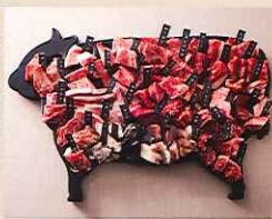
但馬牛 特選41部位セット