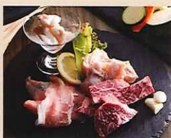
かまくらファミリーセット