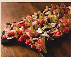
但馬牛 特選61部位セット

※全てのセットに、御飯、スープ、焼き野菜が付きます。(食後にあったかいおしるこサービス) ※全てのセットにかまくら使用料等含まれます。※追加メニューあり(牛肉追加、単品メニューなど)